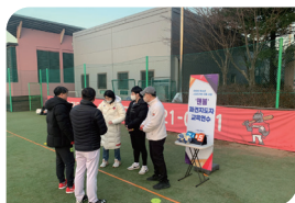
교원 직무연수 및 파견지도자 양성