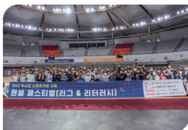
권역별 핸드볼 리그