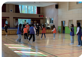
초등 75개교 용품 무상 보급