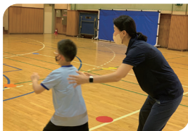
보급학교 핸드볼 파견 강습