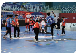
핸볼 페스티벌 개최