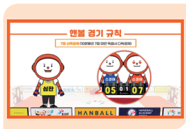
교육 콘텐츠 제작 보급