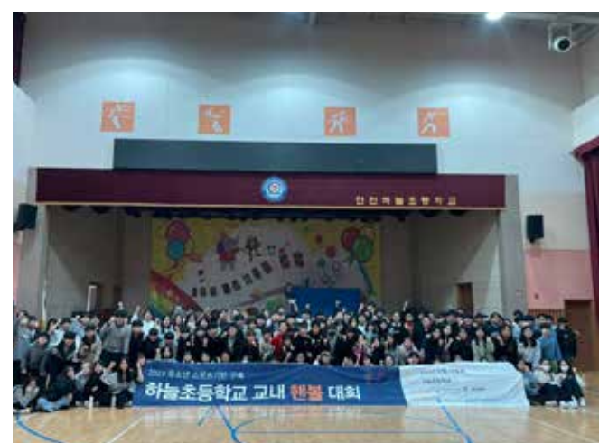
[2023 교내 대회 사진]