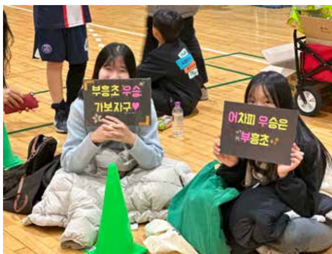
[2023 매칭 대회(부천)]