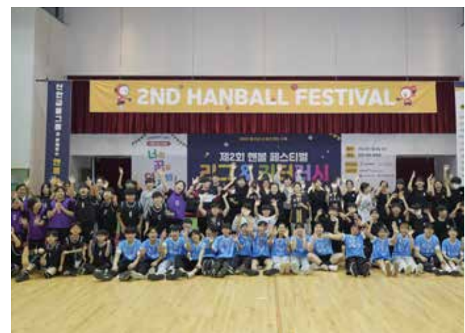
[제2회 한볼 페스티벌 사진]