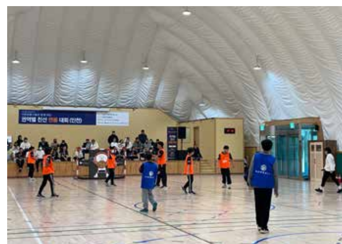
[2023 매칭 대회(인천)]